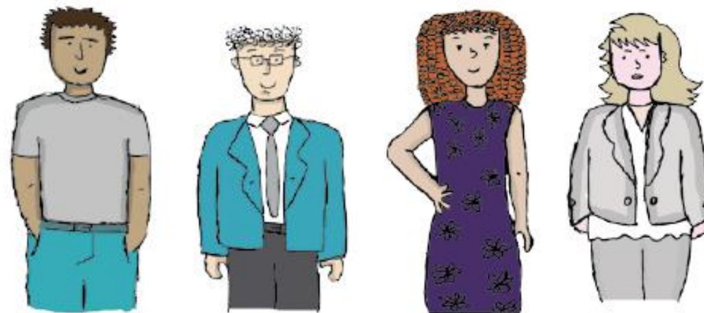
Padres de familia